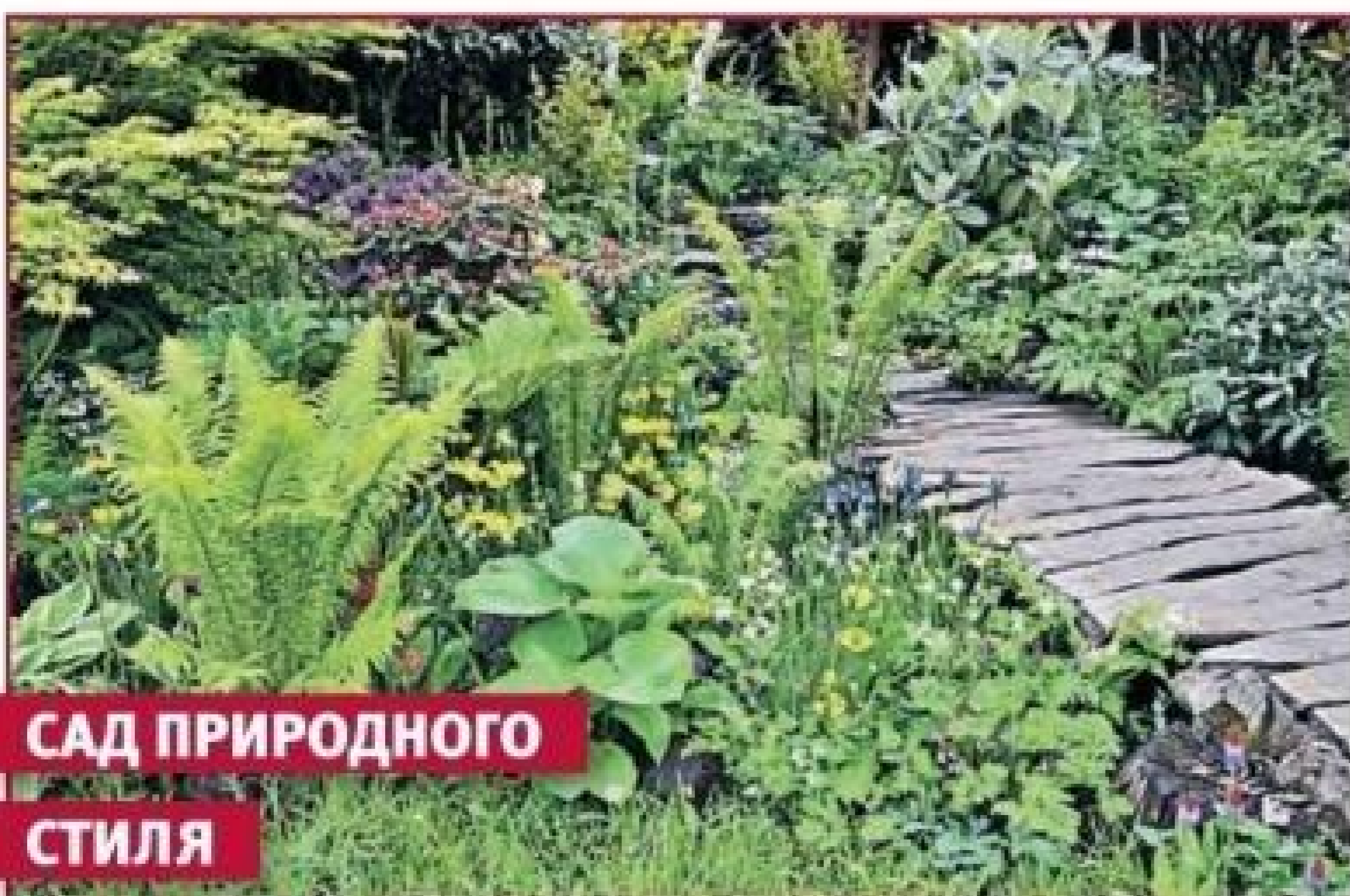
САД ПРИРОДНОГО СТИЛЯ

Злаки – универсальны, они вписываются в любой стиль сада, придают посадкам легкость, воздушность, ажурность. Злаки – это воздух сада, они стали неотъемлемой частью стильных, лаконичных, красивых и комфортных садов.