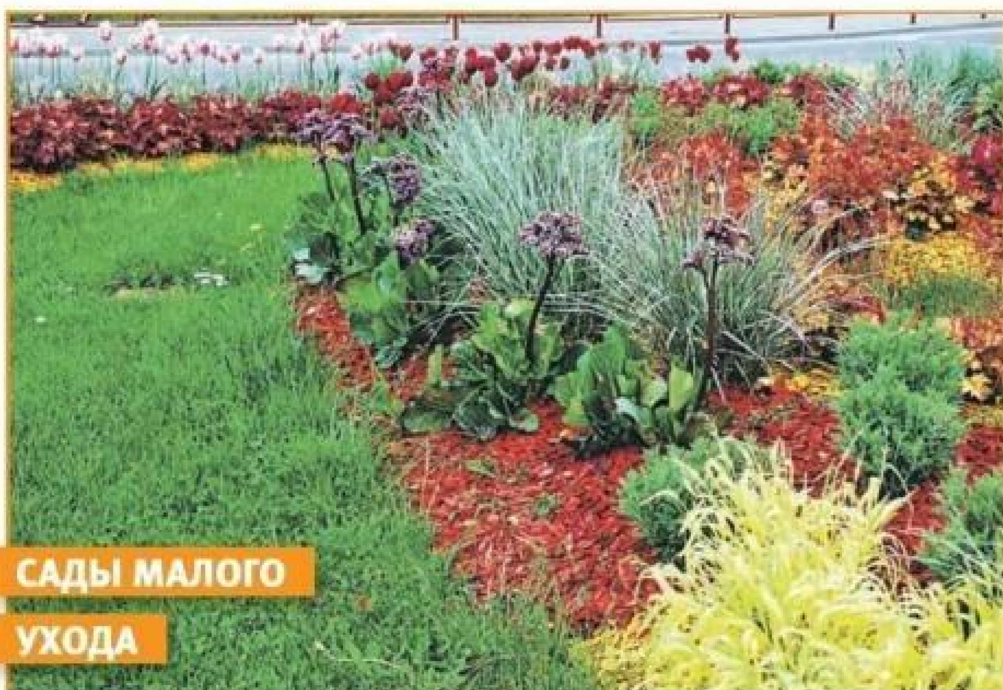
САДЫ МАЛОГО УХОДА

В ландшафтном дизайне все больше стали отдавать предпочтение садам малого ухода. Эта тенденция имеет как эстетические, так и экономические причины.